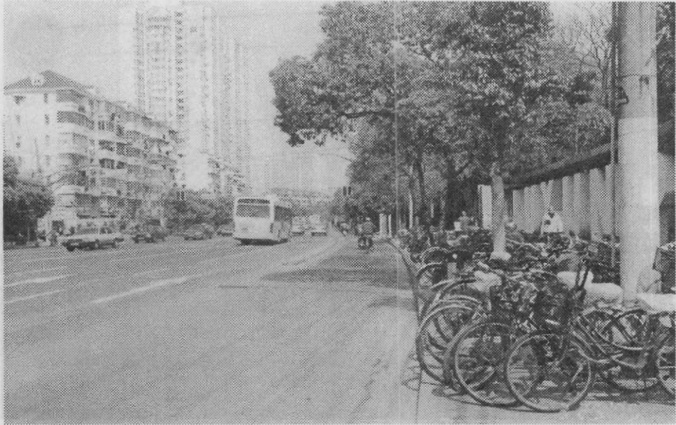
【교통 문화 ▶ 자전거 전용 도로 및 자전거 주차장】