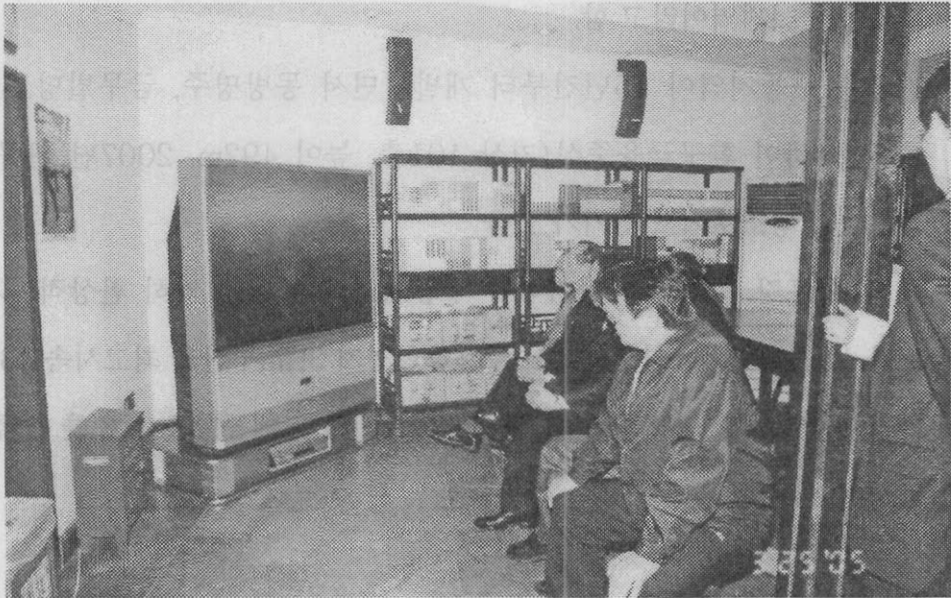
【역사유적지 시찰 ▶상해 임시정부청사 방문(비디오 시청)】