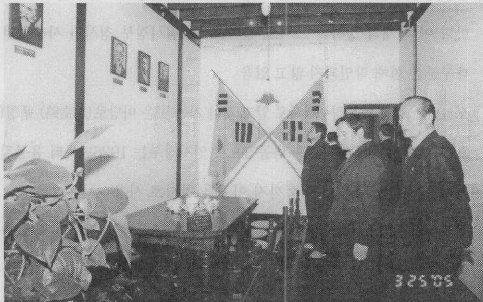
【역사유적지 시찰 ▶상해 임시정부청사 방문(전시관 관람)】