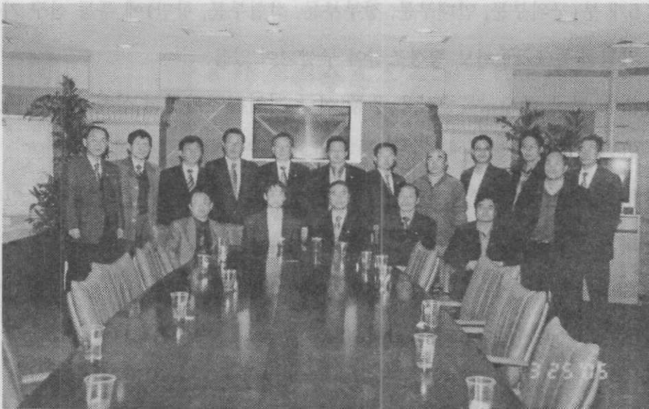
【 푸둥 신규 국제교류 중심 방문 ▶ 기념사진 】

○ 주요 업무로는 투자유치 상담 및 교류 협력, 창업 합작, 합자 기술 교류, 해외 투자 등 광범위한 대외무역 경제 전반의 업무를 관장하고 있음.