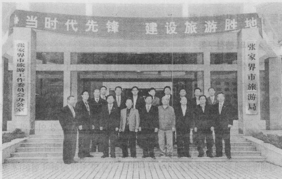
【 장자제(장가계)시 인민정부 방문▶기념사진 】