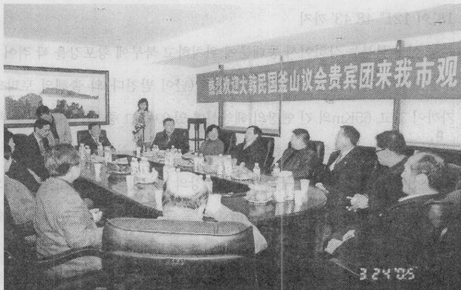
【 장자제시 인민정부 방문▶당서기장 및 시장과의 정보 교류 】