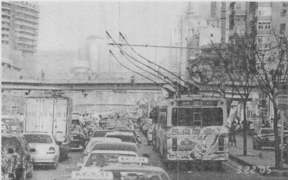
【 교통 문화 ▶ 전차(전기로 운행하는 차) 운행 모습 】