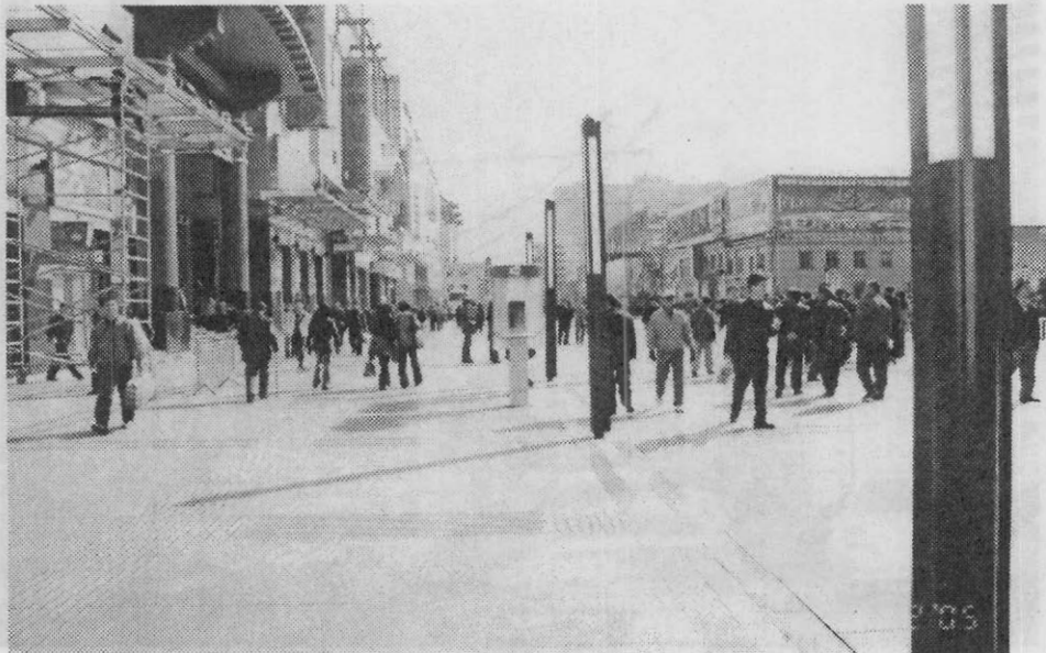
【도시미관 조성 ▶ 북경 왕부정 거리 환경】