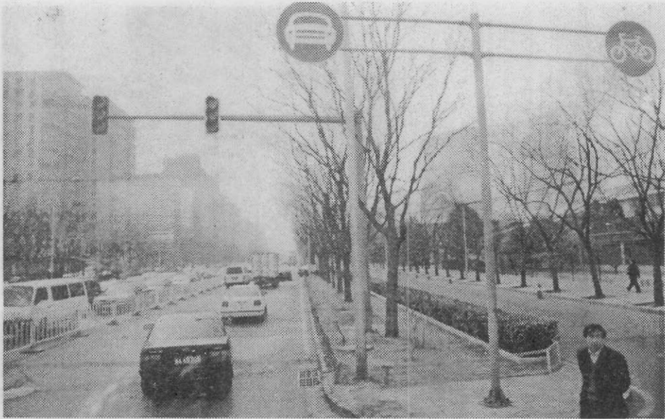
【 교통 문화 ▶ 자동차 및 자전거 전용도로 표지판 】