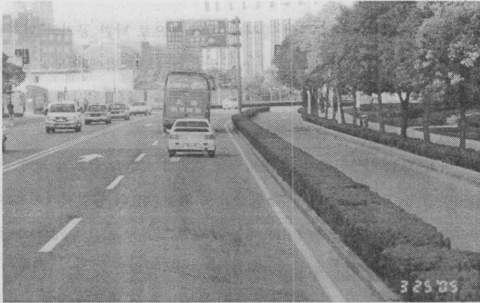
【상해 푸둥신구의 거리환경 ▶ 자전거 도로 구분 경계 화단 및 가로수 전경】