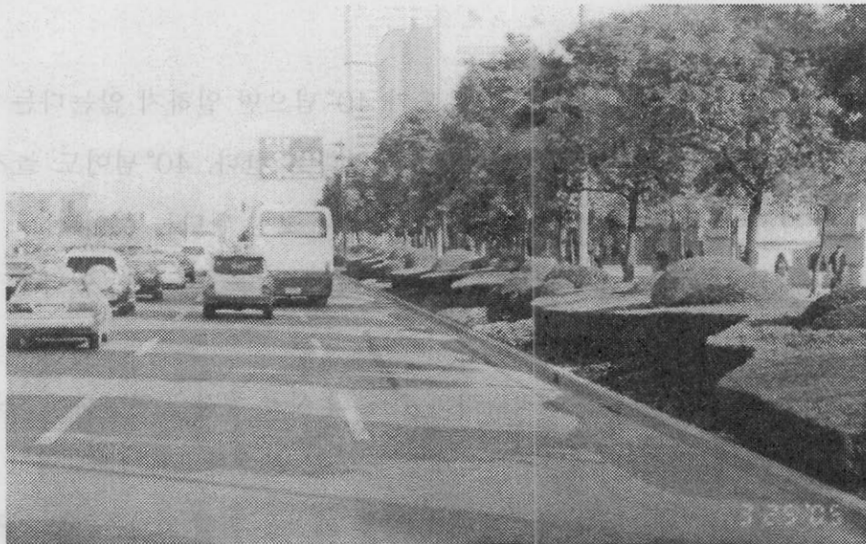
【상해 푸둥신구의 거리환경 ▶ 자전거 도로 구분 경계 화단 및 가로수 전경】